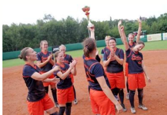
Another cup on the wall (in the clubhouse). A doufáme, že letos přibudou ještě další...