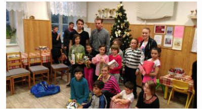
Tak to má o vánocích být: radost a dojetí zavládlo pod stromečkem i v Žatci.