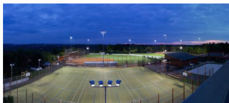
Nafukovací hala bude stát nad hřištěm s umělým povrchem.

Výstavba námi všemi toužebně očekávané nafukovací (přetlakové) haly, která vyroste nad hřištěm s umělým povrchem v areálu ZŠ Dolákova, zdárně pokračuje. Stavba byla zahájena začátkem prosince a i přes malé problémy, které se daří řešit, spěje do finiše. Úspěšně probíhají i jednání s novým vedením radnice Městské části Praha 8 ohledně podepsání smlouvy o pronájmu haly našemu klubu, k čemuž by mělo dojít v nejbližších dnech. Jednání mezi představiteli MČ Praha 8 a naším klubem jsou pro klub pozitivní a tak by 14. ledna mělo dojít k předání haly do užívání klubu i široké veřejnosti. Už na sobotu 17. ledna je v hale naplánován náš první turnaj, Joudrs Indoor Cup 10 Mix pro kategorii T ball, a ještě ten stejný víkend se zde má odehrát i JIC 17 M kadetů. A počínaje pondělím 19. ledna by v hale měly začít již i standardní tréninky. V plánu je i slavnostní otevření haly, o jehož termínu budete včas informováni všemi klubovými komunikačními kanály. Tak si držme všichni palce, ať vše dobře dopadne podle plánu!