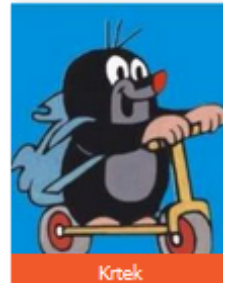
Proti Ekonomu G namísto předsedy nadhazoval Krtek...

Poslední, odložený zápas základní části II. třídy Pražského přeboru mužů naši chlapáci nad Ekonomem G na vlastním hřišti, i bez předsedy na prkně, vyhráli. Dobrý pocit z vítězství i z prvenství v tabulce (za celou sezónu náš tým prohrál jen 3 zápasy), kalí pouze jedna „drobnůstka“: prvenství v tabulce je dělené, stejný počet bodů má i Kotlářka C, se kterou naši borci ze tří vzájemných duelů dva prohráli. Fanoušci jistě mají v paměti poslední přestřelku na Joudrs, která fakticky rozhodla o přímém postupujícím (viz předchozí číslo Buletinu). Ale ještě není nic ztraceno, máme opravný pokus, o postup do I. třídy se popereme v baráži s týmem Starých psů v duelu hraném na 2 vítězná utkání. Takže se už nyní můžeme těšit na opravdu poslední venkovní duel Joudrsáků v této sezóně. A půjde o hodně, tak přijďte fandit!