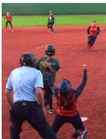
Tahle neskonala radost našich děvčat bohužel propukla ve finálové sérii letos jen jedinkrát...