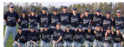
„Držíme spolu, jsme tým, jsme Joudrs“ v kadetech každopádně platí.

Na svůj vrchol sezóny, MČR, se s medailovými ambicemi chystal i náš žákovský tým. Kluci začali svůj sen naplňovat již ve čtvrtfinále s týmem Kunovic, které se odehrálo v pátečním chladném večeru na domácím hřišti, a tudíž za silné podpory joudrsáckých fanoušků. Ti velmi hlasitou kulisou hnali své chlapce za prvním a nakonec jednoznačným vítězstvím. I druhý duel se stejným soupeřem náš tým vyhrál a postoupil do semifinále, které se již odehrávalo, stejně jako zbylé zápasy, na novém hřišti Copacabana pořadajícího Spectra. Ještě tentýž den, po přejezdu na Černý Most, jsme se utkali s černým koněm turnaje, mosteckými Paintbusters. Po vyrovnaném začátku favorit ukázal svou sílu především na pálce a zvítězil. Ani v druhém utkání se stejným soupeřem, hraném již v neděli, se nám nevedlo lépe, naopak, nedokázali jsme nabuzenému Mostu dát ani bod, když sami jsme obdrželi 7 kusů. Po lehkém rozčarování z uniknuvší vidiny finále, na které nám ještě chybějí větší zkušenosti, jsme se začali soustředit na poslední klání turnaje. Vždyť vytoužená medaile byla stále ve hře! V cestě nám stáli Klackaři z Kostelce n. Orlicí. Naši chlapi na ně vlítli jak uragán a po prvních směnách nebylo pochyb, čím vůle po vítězství je silnější. Po vítězství 9:2 se naši žáci i jejich trenéři a mnoho přítomných rodičů nemohli bronzových medailí nabažit. K jejich první velké medaili jim rádi gratulujeme!