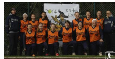
Kdo jiný, než hráčky v oranžovém mohli vyhrát Dýňový pohár (Kürbis Cup)? ☺