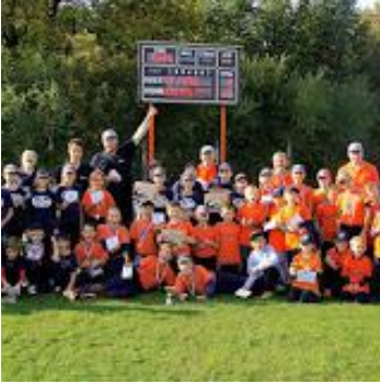
Tak to je naše „Bohnická padesátka“ nejmenších hráčů. Každý rok se má zvyšovat o 10. Dojdeme v jejich počtech až po Vasův běh?