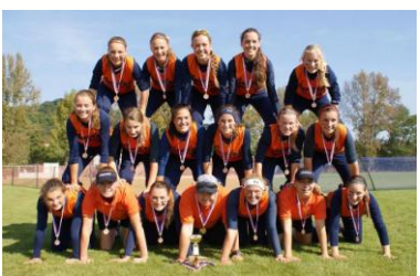
Základy stavby super (zvláště trenér uprostřed ji pevně drží), ale kde je těch 10 zbývajících, aby tuhle bezva pyramidu dokončili? Na soupisce by se určitě našly ☺.