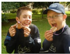
Jeník s Mařenkou by medaile z pardubického perníku našim klukům jistě záviděli.