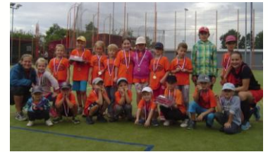
Naše dva týmy na turnaji vytvořili naši nejmenší, členové týmu Mikro.