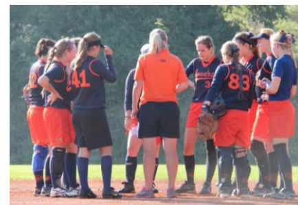
Tak holky, už nám jen zbývá porazit Tempo, a máme po sezóně!

Béčko si postup do finále 2. ligy vybojovalo o chvilku dřív, než Áčko. V posledním dvojutkání základní části ligy přehrálo Dračice z Brna a zajistilo si tak celkové 2. místo a postup do semifinále. V něm se opět během několika dní utkalo s Brňankami a souboj o finále dokázalo vyhrát nejkratším možným způsobem, 3:0 na zápasy. Ty však nebyly vůbec jednoduché, navíc jejich odehrání komplikoval déšť, který si s námi v září opravdu hodně pohrál. Na Joudrs jsme od konce srpna během našich akcí a turnajů téměř neustále sušili hřiště, jinak tomu bylo i v semifinále s Dračicemi. Snad se počasí na finále, jehož první díl se odehraje v sobotu 4.10. v Praze Libuši, umoudří. Soupeřem nám bude ambiciózní tým Tempa, který již loni pomýšlel na postup do extraligy. Nu, čeká nás pěkná podívaná, tak přijďte na tribunu!