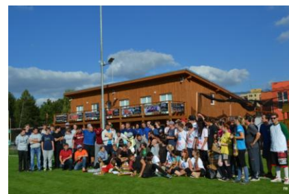
Již po páté se u nás sešli příznivci softballu na turnaji pro veřejnost projektu Sportuje celá Praha 8. Sedm týmů, tedy téměř stovka účastníků. Inu, softball na Osmičce táhne.

V září jsme se zúčastnili hned několika akcí, jejichž cílem bylo představit občanům nejen Prahu 8 Joudrs a softball. Byli jsme vidět hned 2x před OC Krakov (Návrat do školy a Kdo si hraje, nezlobí), v OC Harfa na Harfandění, na festivalu Babí léto v PN Bohnice či na Kobyliském náměstí při akci Zažít město jinak – Kobylisení. Ale uspořádali jsme i vlastní aktivity v našem areálu: Sportovní den pro seniory a již tradiční turnaj pro veřejnost, který byl součástí projektu MČ Praha 8 Sportuje celá Praha 8. A v rámci Měsíce náborů pořádaném Magistrátem hl. města Prahy jsme uspořádali tři ukázkové tréninky softballu a 2 tréninky prezentující cvičení v našem týmu Mikro. Navíc jsme založili 2 zcela nové kroužky T ballu na dalších dvou základních školách. O aktivitách uspořádaných pro klienty PN Bohnice již byla řeč v předchozím článku. Byl to docela „záhuľ“, zvládnout vše během jednoho měsíce, ale podle ohlasů jsme to zvládli ke spokojenosti všech zúčastněných. Díky všem Joudrsákům, kteří se na akcích podíleli!