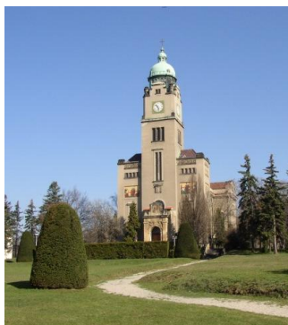
Kostel sv. Václava je dominantou PN Bohnice, ale její areál skýtá celou řadu nádherných zákoutí. Park, farma, divadlo. To vše zde najdete. Tak přijďte pobejt!

Všichni: 28. listopadu Společenský večer Joudrs, v KD Ládví