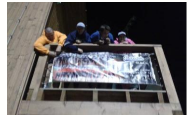
Pověste se ho vejš, ať se houπά! Trenéři T ballu vyvěšují na clubhouse novotou vonící plakát svého týmu.