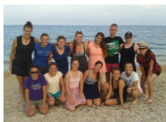
Někdy to platí i naopak: nejdříve zábava (před PMEZ) a pak práce (Final Four).