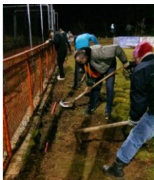
Tak teď už to jen položit (kabel).