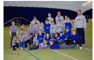
Joudrs Grey a Royal ve zbrusu nových dresích.