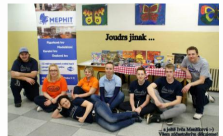
Deskový pořadatelský Joudrs tým.