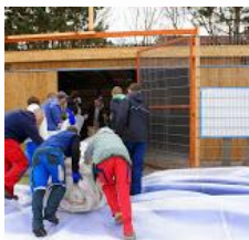
Minuta pravdy: vejde se to tam?