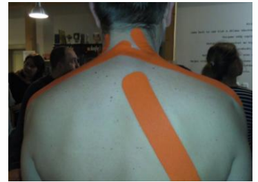
Takhle „vystajlovaný“ odcházel z tejpingu mnohý účastník tohoto zábavného školení.

Náš klub si jako jednu z priorit nadcházejícího období stanovil zvyšování odborné úrovně svých trenérů. Většina z nich vlastní trenérskou licenci minimálně 3. třídy, ale klub rád investuje do jejich dalšího vzdělávání. A tak pro ně připravil seriál školení a seminářů na různá témata. Již jsme absolvovali seminář z psychologie na téma motivace a také školení z tejpingu, kde jsme se náramně pobavili při názorných ukázkách a řada účastníků odešla domů hned s několika tejpny na těle. Dále se můžeme těšit na školení ze zapisování zápasu (18.2.), kaučování nadhozu (25.2.) či taktiky kaučování (4.3.). A jistě budou následovat další na témata, ve kterých se naši trenéři chtějí zdokonalovat. Tak si je nenechte ujít!