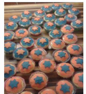
Už zbývá jen přebarvit šmouly a natočit Oranžovomodrý svět ☺

Minulý týden v sobotu 17. ledna se měl uskutečnit náš první velký halový turnaj Joudrs Indoor Cup 10. Bohužel počasí nepřálo a tak se naše nová nafukovací hala na Joudrs nestihla připravit, ale my trenéři a i děti ze všech tří týmů jsme byli natěšeni a chtěli jsme hrát. Naštěstí má náš pan předseda vždycky něco v záloze a tak jsme mohli v sobotu odpoledne odjet do tělocvičny v Satalicích a tam se dostatečně vyřádit. Děti jsme rozdělili do 4 družstev, která mezi sebou odehrála každé po čtyřech zápasech. Děti, trenéři i rodiče byli nadšeni a já bych chtěla poděkovat za sladké odměny pro děti od Beránků a Wenclů. Každé dítě si nakonec odneslo i diplom a malou Joudrs muffinku za účast na tomto Joudrs miniturnaji.