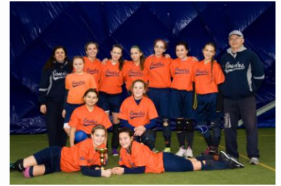
Ta naše jedenáctka válí, ať je to venku nebo v hali...

Prvním turnajem v nové hale, který se konal jen pár hodin po jejím oficiálním otevření, byl žákyňský JIC 13 W. Oba naše týmy do bojů s dalšími 7 družstvy vstoupily srdnatě. Tým starších žákyň nenašel ve 3 utkáních základní skupiny ani jednou přemožitele a zaslouženě postoupil z první příčky přímo do semifinále, když si jednoznačně poradil i s jedním z favoritů, celkem Eagles. Mladší spoluhráčky je v odpoledních kláních své skupiny málem napodobily: dva zápasy vyhrály, jednu remizovaly a pouze jednou odešly ze hřiště poražené, když nestačily na Chomutov. Ve čtvrtfinále se pak v neděli utkaly s Eagles a k překvapení všech zvítězily! V boji o postup do finále se tak střetly oba naši zástupci ve vzájemném souboji, ve kterém nakonec slavila zkušenost starších děvčat. Mladší v následném boji o bronz ani napodruhé nestačily na chomutovské Bobřice, ale tým složený z nováčků a loňských Tballistek sklidil za předvedené výkony zasloužený aplaus mnoha přihlížejících fanoušků. Finále s Kotlářkou přineslo reprízu utkání ze skupiny a ani tentokrát naše starší děvčata nezaváhala a zodpovědným výkonem v útoku i v obraně pokřtila novou halu premiérovým zlatem. Joudrs, oléé!