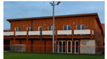
Krámek se nachází v clubhouse.