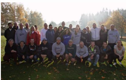
Nádherné počasí, skvělá nálada, super výlet na Rabí, báječní lidé = výjezdní zasedání 2015.