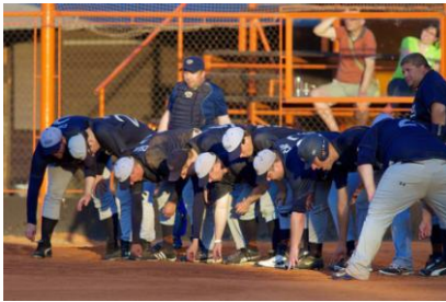
Tentokrát se chlapi museli před svým barážovým soupeřem hluboce sklonit.