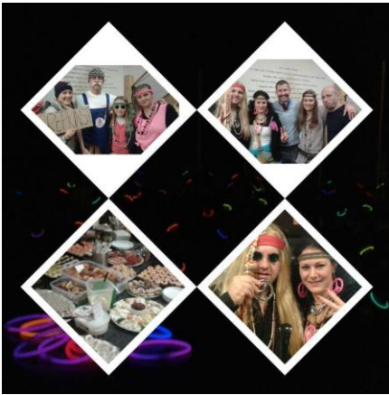
3. Silvestrovská Joudrs párty aneb když se podaří, co se zdařit má!