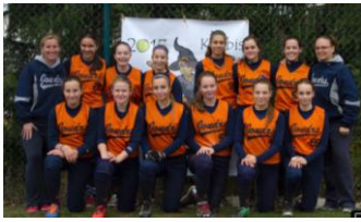
Joudrsačky na letošním Kürbis Cupu.