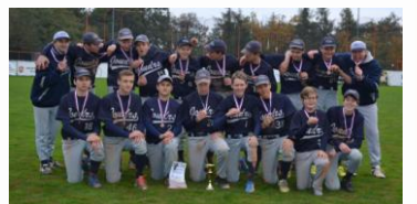
Kadeti - 3. místo na MČR.