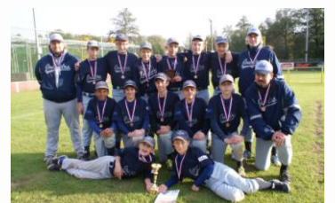
Žáci - 3. místo na MČR.