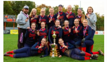
A - tým žen - Mistři ČR a 2. místo v Poháru vítězů poháru.