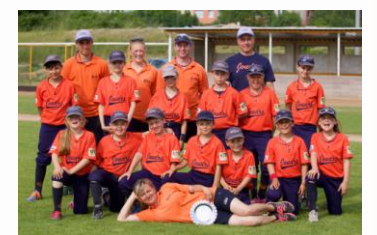
T ball - 3. místo na MČR.