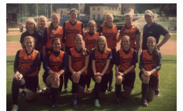
Juniorky - 3. místo na MČR.