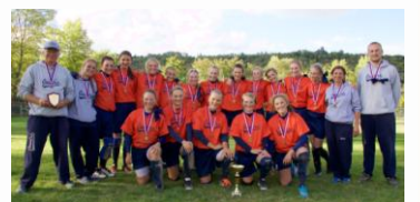
Žákyňe - Mistři ČR.