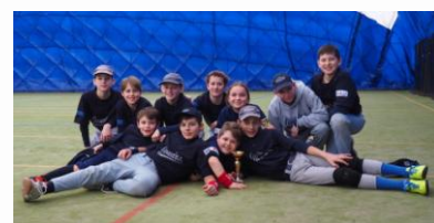
Stříbrní žáci starší (nahore) a žáci mladší.