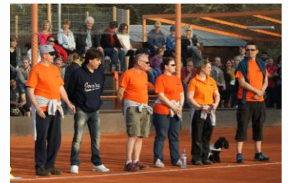
Softákům patří, jako poděkování klubu za jejich práci, i čestné místo u domácí mety při každoročním slavnostním otevření sezóny.