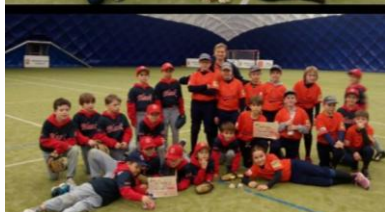
Úspěšní medailisté: nahore vítězní Navy, dole 2x bronzové Orange