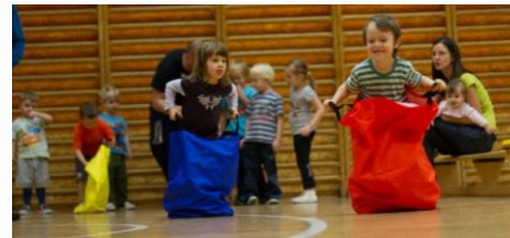
V našem kroužku se děti učí nejen správným sportovním základům, ale zažívají i plno legrace.

Ještě několik posledních volných míst zbývá v kroužku Sportování pro nejmenší - Mikro tým pro 1. polovinu roku 2016 (únor - červen) ve věkové kategorii dětí 5 - 6 let (Mikro) na cvičení v pondělí a ve středu v čase 18:00 - 19:00. Na cvičení můžete chodit v obou, nebo v některém z uvedených dní. Při frekvenci cvičení 1x týdně činí příspěvky za 1 pololetí 1 100 Kč, při frekvenci 2x týdně pak 2 200 Kč. V případě zájmu kontaktujte trenéry prostřednictvím e-mailu na adrese: joudrs.mikro@seznam.cz .