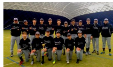
Vítězné turnaje, kadeti starší (nahore), a kadeti mladší.