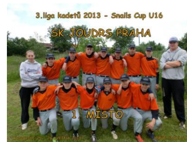
Chlapi a Karin, super práce!

Ve druhém kole své soutěže, III. ligy, vyválčili naši kadeti v Kunovicích své první zlato. Na Jižní Moravu tým odjížděl natěšený a posílený o další přírůstky, o motivaci do zápasů nebyla nouze. Hned v tom prvním jsme se postavili vítězi předchozího turnaje Ostrovanům z Ostrova n.O. a hned v první směně jim nasázeli 10 bodů a své vedení udrželi až do konce. Podobně jsme se vypořádali i s ostravskou Katalpou, která se navíc 4x dívala na naše běžené homeruny. Vítězstvím v následujícím zápase jsme se již mohli dostat do finále. Naštěstí jsme namísto nervozity pokračovali v duchu předchozích utkání. Domácí Šneci nám zkrátka nestačili a my po 3 zápasech s nádherným skóre 55:26 byli ve finále! V posledním zápase skupiny nám tak polevila koncentrace a s Č. Těšínem jsme vysoko rupli. Ale pak to přišlo: odvěta se ve finále Ostrovanům nepodařila a my po nadšeném výkonu obohatili naši síň slávy o premiérový zlatý pohár!