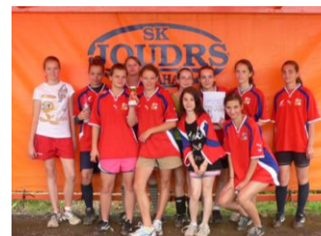
Celkový vítěz kategorie starších dívek: Gymnázium Ústavní (poznáte šestici z Joudrs?)

Po loňském premiérovém ročníku se T ballová školní liga Prahy 8 pevně usadila v termínové listině sportovních akcí základních a středních škol nejen z Osmičky. Projekt, který vytvořil a zastřešuje náš klub, se dále úspěšně rozvíjel i v letošním, právě uplynulém školním roce a zájem o T ball na školách stále roste. Celkem se některého z 6 turnajů v obou kategoriích zúčastnilo 8 škol, některé postavily v turnajích i dva týmy. A hráčky Joudrs významně přispěly k celkovému vítězství svých škol. V mladších dívkách celkově zvítězila "naše" ZŠ Doláková, ve starších dívkách pak celý rok kralovala děvčata z Gymnázia Ústavní. A především díky Lize neustále vzrůstá i naše členská základna v týmech žákyň a kadetek, což nám závidí ve všech českých klubech!