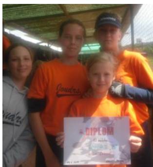
18 červen, památný den žákyňského Běčka – první vítězství na venkovním turnaji. A mohlo být ještě líp...

Předposlední extraligový turnaj na Krči nezastihl v pohodě především pořadatele, který snad jakoby ani žádný turnaj nepořádal... Oba naši zástupci se však soustředili především na hru a dočkali se příjemných premiér. Áčko k překvapení všech zdolalo favorita ze Dvora, kterému hned v první směně nasázelo 5 bodů, a soupeř se již z úvodního šoku nevzpamatoval. I při třech turnajových výhrách a 2 prohrách jsme však skončili až sedmí. Běčko málem způsobilo obrovskou senzací. Při dobré konstalaci se mohlo probít až do semifinále. V nádherném zápase otočilo v poslední směně proti Merklínu, který předtím udolal Krč. Té jsme však my podlehli a tak o všem rozhodl hned první prohraný zápas s Trutnovem. V boji o předposlední místo se nám pak bohužel nepodařilo porazit Ledenice, přesto bylo premiérové vítězství stejně sladké jako zmrzlina pro oba týmy na závěr turnaje.