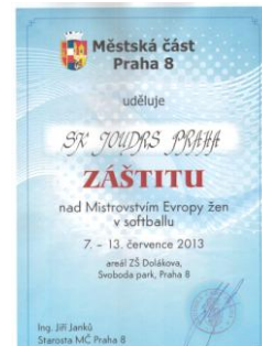
Záštitu starosty MČ Praha 8 Jiřího Janků nad ME 2013.

Za rok o tomto čase, přesně ve dnech 7. – 13. července 2013, se na naše hřiště sjedou nejlepší softballistky Starého kontinentu. Podařilo se nám totiž získat pořadatelství nejdůležitějšího ženského šampionátu příštího roku, Mistrovství Evropy. Příznačně v roce, kdy český softball oslaví 50 let, příznačně v roce oslav 15. narozenin našeho klubu. Sportovní událost tak vrcholně úrovně osmý pražský obvod nepamatuje, proto ji mezi své priority zařadila i naše Městská část a záštitu nad ní osobně převzal starosta Jiří Janků. Ve spolupráci s radnicí připravujeme řadu akcí a doprovodných programů. Mistrovství Evropy na Joudrs tak bude na Osmičce sportovní akcí roku 2013 a příštích 12 měsíců bude rokem softballu. Pojďme tuto příležitost využít a pořádně zpropagovat softball i Joudrs mezi širokou veřejností. Ukažme, že i takové akce jako ME umíme skvěle uspořádat a že patříme ke špičce nejen na poli sportovním, ale i organizačním. Čeká nás tak sice hodně práce, ale věříme, že výsledek bude stát za to!