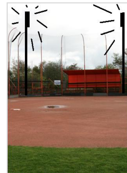
A takhle nějak by to mohlo vypadat ...