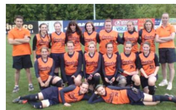
Vidíte, jak jsme se během zápasu se Spektrem krásně odálili?

Kombinovaný tým kadetek a hráček Běčka vyrazil do krčského areálu s cílem především si zahrát. Ostrava, Storms i Krč s hráčkami s druholigovými zkušenostmi byli nad naše možnosti. Zato utkání se Spektrem už bylo vyrovnanější s nečekaně dramatickým vývojem. Po čtyřech směnách a 60 min jsme chtěli slavit první vítězství, leč ouha, komisař turnaje nás nahnal zpět do hřiště s tím, že play off se hraje na 6 směn. Naštěstí nás to nerozhodilo, byť se náš slibný náskok ztenčil na minimum, ale cenné vítězství jsme nakonec po 2,5 hodinách na prudkém slunci silou vůle udrželi. V posledním zápase nám však již chyběly síly a tak jsme nakonec skončili celkově 6., ale ne poslední. A to je dobrá zpráva, ne?