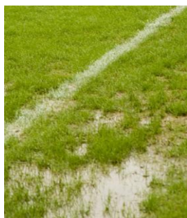
Takhle to vypadalo na hřišti v sobotu. V neděli už pářilo sluníčko...