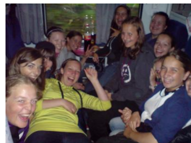
Pokus o překonání rekordu v maximálním počtu hráček v jednom kupě málem vyšel.

Prohru v prvním zápase proti Polkám na pátek 13. svést nemůžeme, byly lepší a my jim výhru navíc ještě umožnili špatnou hrou. Že by únava po cestě? Vyspínané jsme už proti Sovám z Brna předvedli, jak se má hrát a otočit špatně se vyvíjející utkání. Proti slovenským reprezentantkám jsme však šli s přílišným respektem a zápas ztratili ve svých hlavách snad ještě před prvním nadhozem. Slunečné počasí vystřídal prudký déšť, ale přesto jsme proti Krči hráli a urputně bojovali o další vítězství. To se nám nakonec podařilo, ale to jsme ještě netušili, že další zápasy už neodehrajeme, počasí bylo proti. A tak jsme skončili na děleném 5. místě, což je naše zatím nejlepší letošní umístění.