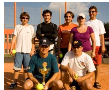
I vy můžete vaši firmě získat vítězný pohár, ale především se s kolegy skvěle pobavit.