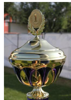
Takových ať máme letos co nejvíc!