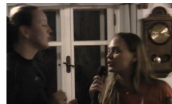
Vaška vystřídala v populárním duu Léňa a Bílá orchidej zněla líp než v originále.

Únor jsme začali soustředěním na horách. Vysočina nás přivítala krásným, i když mrazivým počasím, takže jedním z hlavních úkolů bylo udržovat oheň v chatě. Přes den jsme řádili na svahu; většina z nás stála na prkně poprvé, takže o pády a humorné situace nebyla nouze. Večer jsme se pak věnovali stmelování kolektivu za pomoci karaoke, scének a soutěží. Došlo i na sjezd po schodech na matraci. Inu, velmi vydařený prodloužený víkend! Závěr měsíce patřil halové Krčandě, kde naše dva týmy zažily zcela odlišný průběh turnaje. Modrým se příliš nedařilo přetavit snahu ve vítězství, oranžoví naopak vyhráli svou skupinu. Neděle pak přinesla zlepšení úrovně hry modrých a pěkné zápasy s chlapeckými týmy domácích, byť ani jeden neskončil výhrou. Oranžovým se bohužel závěr turnaje výsledkově nepodařilo dotáhnout k medailovým pozicím, přesto je potřeba naše děvčata pochválit za předvedenou hru.