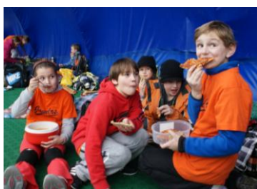
Jak k dílu, tak k jídlu.

Jak jsme domácí halovky začali, tak je i končíme – bronzem!