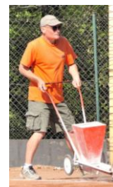
Šéf S.O.F.T. v akci