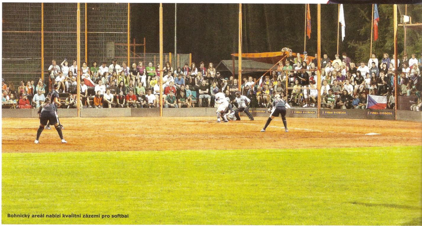
Bohnický areál nabízí kvalitní zázemí pro softbal