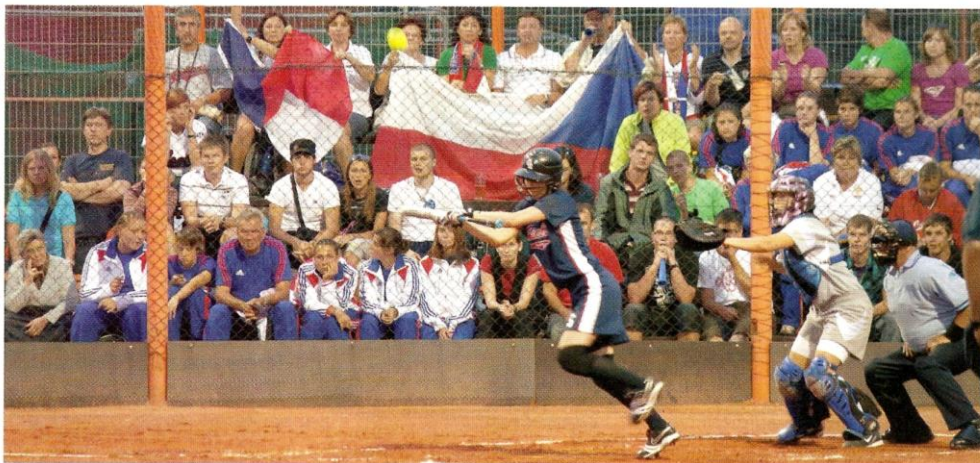
Evropský šampionát se blíží, o dramatická utkání určitě nebude nouze

V areálu Joudrs Praha při ZŠ Dolákova v Bohnicích vrcholí poslední přípravy, do zahájení Mistrovství Evropy v softbalu žen zbývá už jen pár dní. Slavnostní otevřecí ceremoniál se uskuteční v neděli 7. července 2013 od 18.45 hodin. Největší turnaj starého kontinentu pak bude pokračovat po celých dalších šest dní. A vy můžete být u toho.