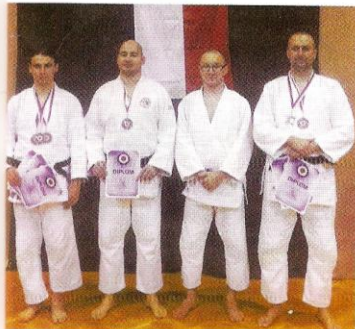
► Úspěšní judisté Prahy 8 s medailemi.