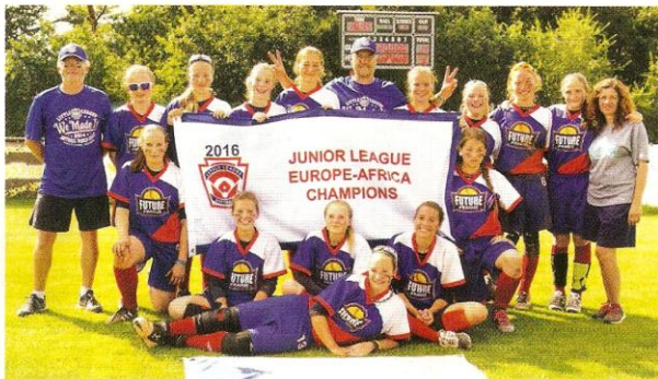
VÍTĚZNÝ TÝM výběru Prahy se sedmi hráčkami Joudrs.

Evropsko-africká kvalifikace se v historii této prestižní softbalové soutěže uskutečnila v České republice vůbec poprvé. Pořadatelská země měla podle pravidel Little League právo nasadit do turnaje dva domácí výběry. A tak se v Praze kromě vítězů národních kvalifikací Itálie, Holandska a domácího výběru severních a východních Čech startující pod názvem NorthEast turnaje zúčastnil