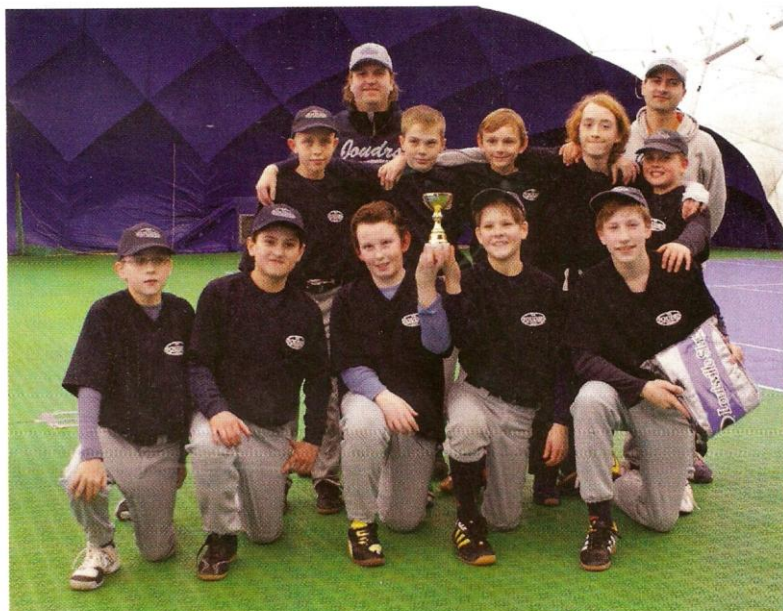
Joudrs již dlouho nejsou jen klubem pro ženy

Softbalový klub Joudrs Praha je aspirantem na zápis do knihy rekordů vzhledem k počtu pořádaných zimních halových turnajů. Za letošní zimní část sezóny jich totiž uspořádá neuvěřitelných 32, z toho 13 víkendových. To představuje účast více než 200 dívčích a chlapeckých týmů, tedy téměř třech tisíc hráček a hráčů z celé ČR.