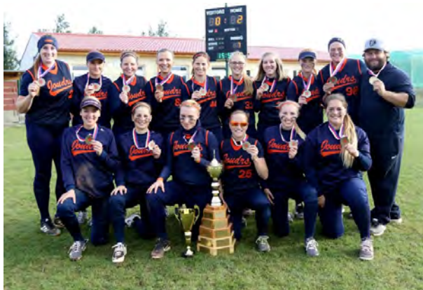
A - tým žen